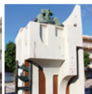
4 Monument a Charlie Rivel