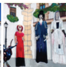
3 Mural de la Festa Major