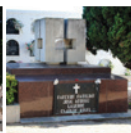
5 Panteó familiar