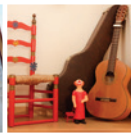
2 Exposició Permanent del Pallasso Charlie Rivel