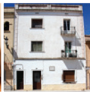
3 Casa natal de Charlie Rivel