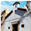
7 Ermita de Sant Antoni de Pàdua