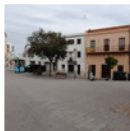
6 Plaça de la Font