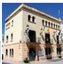
2 Plaça de la Vila