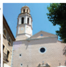
5 Església de Santa Maria de Cubelles