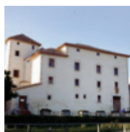
1 Castell de Cubelles