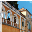
8 Can Travé