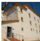
1 Castell de Cubelles