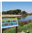
6 Espai natural de la desembocadura del riu Foix