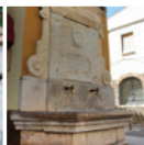
4 Font del carrer Major