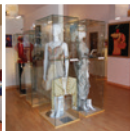
10 Exposició Permanent del Pallasso Charlie Rivel