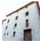
1 Castell de Cubelles