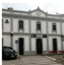
3 Estació de Cubelles