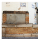
3 Font del carrer Sant Antoni, font amb abeurador