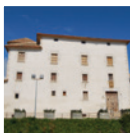
1 Castell de Cubelles