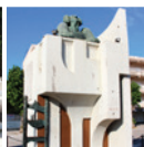
6 Monument a Charlie Rivel