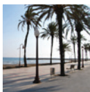
5 Passeig Marítim