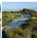
6 Espai natural de la desembocadura del riu Foix