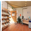
9 Oficina Municipal de Turisme de Cubelles