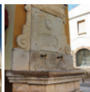
2 Font del carrer Major, font del Lleó