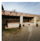
5 Safareigs municipals