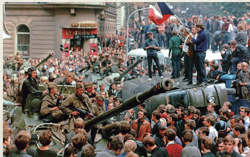
Una imatge de la Primavera de Praga, amb els tancs soviètics rodejats de gent que protestava.