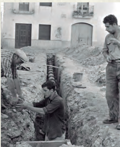
Obres del clavegueram a la plaça de la Vila (AAP).

Però després, un home d'esperit pagès com ell, es planyia de la minva de l'agricultura en detriment del sector del totxo: "A voltes el cap ens roda, ens apar veure un daltabaix quan recordem nostre terme, encatit de camps daurats i vinyes verdes abandonades, aquells prats convertits en llastimosos erms, grisos, sense vida, on s'hi encomana la tristor del ventre eixorc, sense esperances de nova vida. Vol de corbs, com nuvolats de gropada, giravolen per l'espai. Mercaders, cuita corrent, esmicolen el terme, l'adineren i el venen a bocins. Els