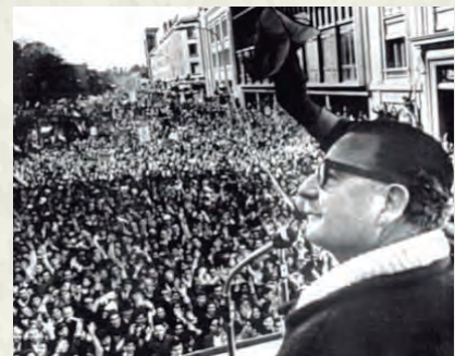
Salvador Allende, el setembre de 1970, quan acabava de guanyar les eleccions.