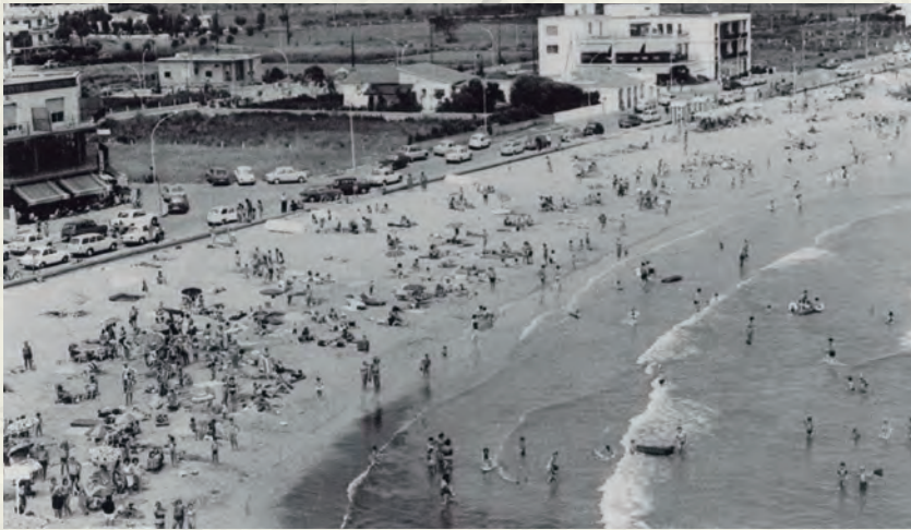
La platja, a finals de la dècada.