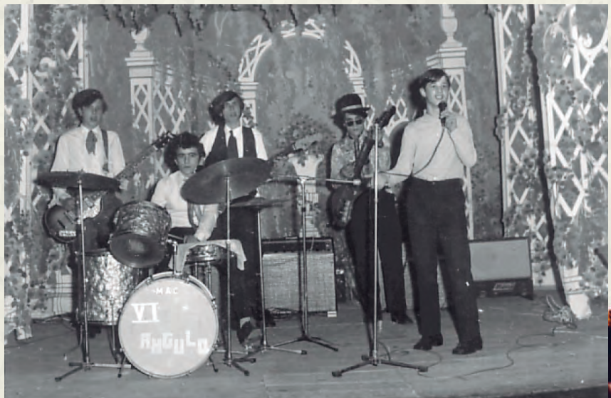
El grup VI Angulo actuant a L'Aliança.