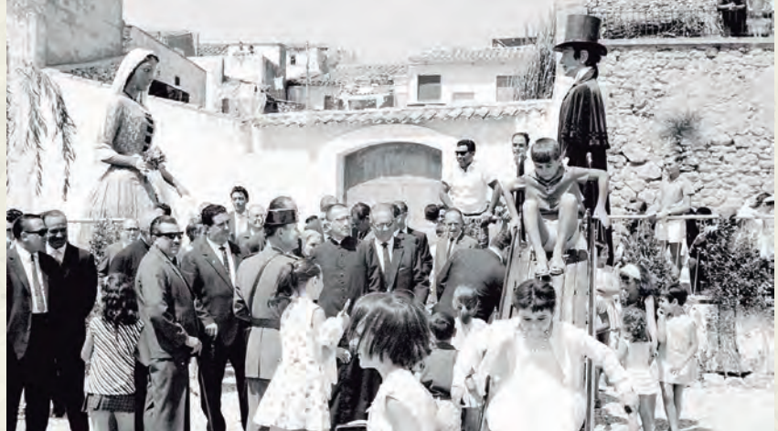
Inauguració del primer parc infantil (AAP).

Va ser durant la festa major que es van produir un seguit d'inauguracions. Cal esmentar, en primer lloc, la Clínica Rural, és a dir, la casa del metge, beneïda el 14 d'agost. La Clínica Rural