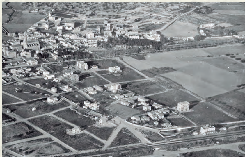
Vista aèria de Cubelles a mitjan anys seixanta