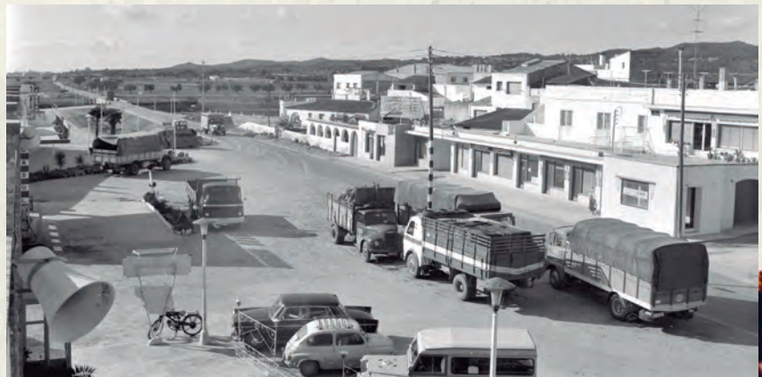
La benzineria i la carretera (AAP).

Quan a final d'estiu marxava el turisme estranger, amb els seus hàbits innovadors i desinhibits, es feia més patent que Catalunya i la resta de l'Estat espanyol continuaven sotmeses a una dictadura. A final d'any n'hi va