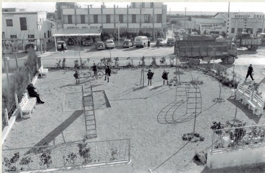
Una perspectiva del parc infantil, el 1966 (AAP).

manifestació va acabar amb una brutal intervenció policial que va tenir forta repercussió internacional. En el terreny cultural, la cançó catalana aconsegueix una destacada difusió internacional gràcies a Raimon, que el 7 de juny fa per primer cop un recital al music hall més important d'Europa: l'Olympia de París. En el pla esportiu, el Barça s'adjudicava un títol europeu, la Copa de Fires, per tercera vegada a la seva història. A nivell estatal el tema estrella va ser l'accident nuclear a Palomares (Almeria), amb una fuga radioactiva que volgué ser minimitzada pels governs nord-americà i espanyol. Estudis posteriors han determinat que va existir contaminació radioactiva. Dels grans fets que van succeir al món esmentarem el nomenament d'Indira Ghandi com a primera ministra de l'Índia i la celebració de la Copa del Món de futbol d'Anglaterra, guanyada per la selecció amfitriona.