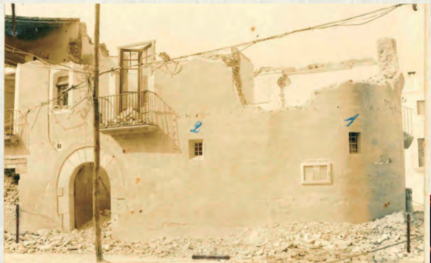
Obres de renovació de la rectoria.