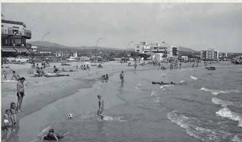
Una foto de la platja, entre el Solimar i el Nàutic.

accedia a la presidència de Xile. Tres anys més tard moriria a causa d'un sagnant cop d'estat que va sumir el país en una terrible dictadura militar de setze anys de durada. També va ser el novembre que va morir una de les grans figures del segle i de la història de França: Charles de Gaulle. I uns mesos abans, a l'abril, els Beatles anunciaven la seva dissolució. És curiós que el trencament del grup amb més influència d'aquell decenni coincidís, pràcticament, amb el final de la dècada prodigiosa.