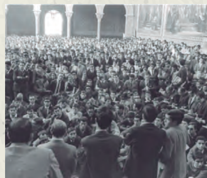
Una imatge de la Caputxinada.

tots els assistents van ser durament sancionats. Però la Caputxinada ha passat a la història com una de les fites de la lluita antifranquista a Catalunya. I és que, a més, l'11 de maig de 1966 va tenir lloc una concentració d'uns 130 capellans davant la Jefatura Superior de Policia de Barcelona per protestar per l'interrogatori i tortura que presumptament estava rebent un estudiant universitari detingut després de la Caputxinada. La