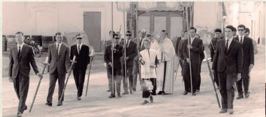
La processó de Corpus de 1965 al seu pas per la plaça de la Font.

I parlant de música, un dels grans esdeveniments a Catalunya va ser l'actuació dels Beatles a la