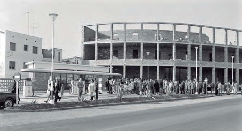
Inauguració de la segona benzínera, el 1969. Al costat, l'Hotel Principat en construcció