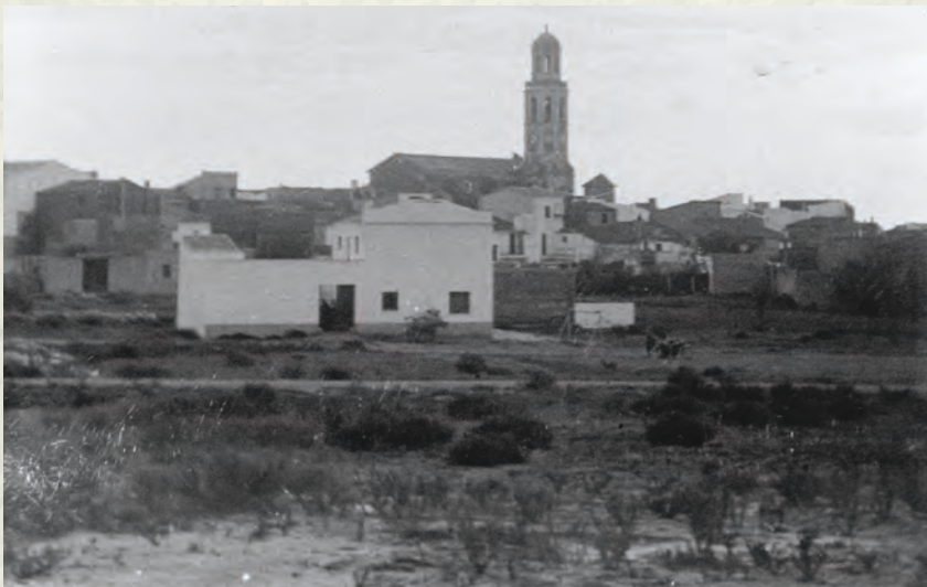
El barri de la Creu, quan es començava a urbanitzar (AAP).

De 1962 també cal comentar que el mes d'estiu va desaparèixer el camp de futbol conegut com de cal Víctor. El motiu: l'inici de la urbanització d'aquella zona. El terreny de joc, inaugurat en la fes-