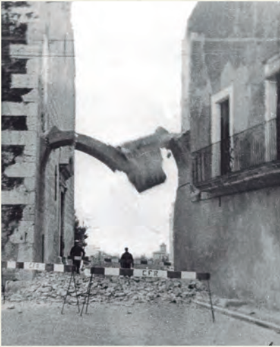
L'enderroc del pont del campanar.

Adéu al pont del campanar. L'afar Serrat. La final de les ampolles. Martin Luther King. Robert Kennedy. El Maig francès. La Primavera de Praga. El Black Power