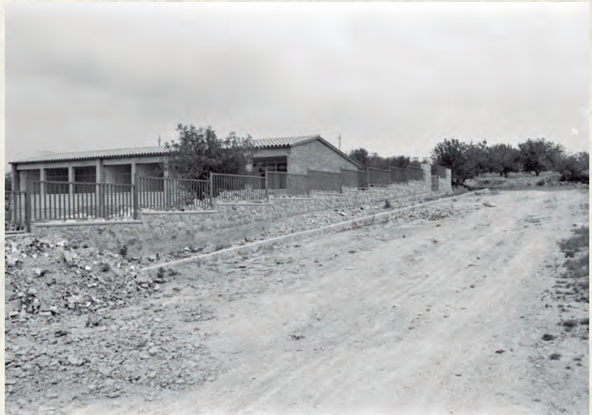
El que seria l'Escola Charlie Rivel, en fase de construcció.