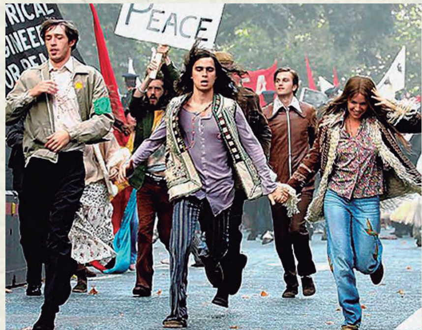
El moviment hippy, amb el lema Peace and love, fou contrari a la guerra del Vietnam.

També és al 1965 que es clausura el Concili Vaticà II i comença la Revolució Cultural a la Xina, mentre que a l'Estat espanyol