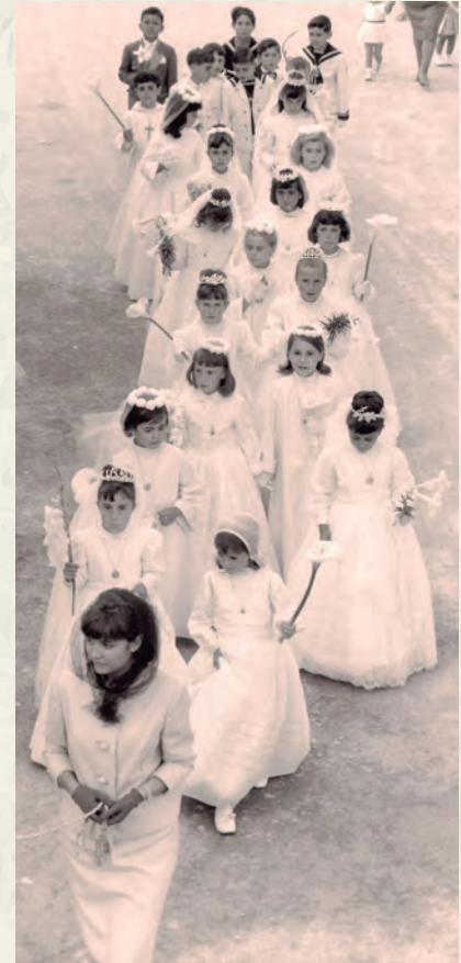
Les nenes i nens que aquell any van fer la Primera Comunió, van participar en la processó de Corpus (AAP).

mundial de boxa i una de les icones esportives del segle XX, Cassius Clay, després Muhammad Ali, qui el 1967 es va declarar objector de consciència en la guerra del Vietnam, contribuint a la defensa dels drets civils als Estats Units.