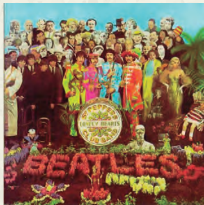
La portada de l'àlbum Sgt. Pepper's Lonely Hearts Club Band.

En un sentit molt més amable, l'1 de juny els Beatles van publicar el disc més important de la història de la música, Sgt. Pepper's Lonely Hearts Club Band . El mateix mes es va celebrar