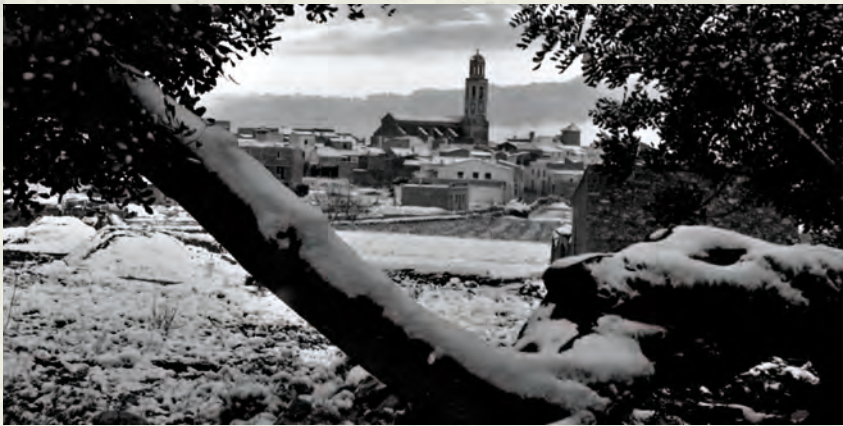
Una vista del poble, el dia de Sant Esteve, després de la nevada de Nadal (AAP).