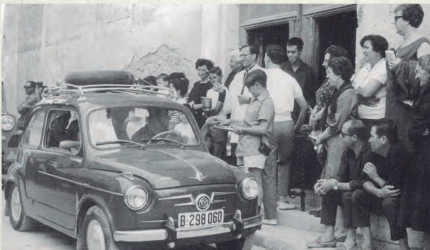
Benedicció de vehicles per Sant Cristòfol (AAP).

El creixement de Cubelles es veia de manera contradictòria entre la població autòctona. Si bé era evident que beneficiava l'economia local, per altra banda s'observava amb recança la desaparició de frondosos terrenys agrícoles i d'àrees boscoses. Això ho retratava perfectament el cronista Joan Roig en el seu article del programa de festa major. Amb el títol de Cubelles transformada , per un cantó lloava el canvi que anava experimentant el municipi: "S'urbanitza el pla, la muntanya i a frec a frec de mar. Surten casalots a tot arreu, camins i avingudes creuen el terme, brollen bars i càmpings; apartaments i bungalows; hostals