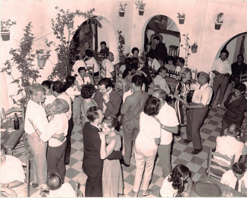
El Patiò Andaluz, en una imatge de 1964.

Monumental de Barcelona el dia 5 de juliol. Alguns joves cubellencs van tenir la sort d'assistir a aquell històric concert, l'únic que el grup de Liverpool va fer a la capital catalana en tota la seva trajectòria.