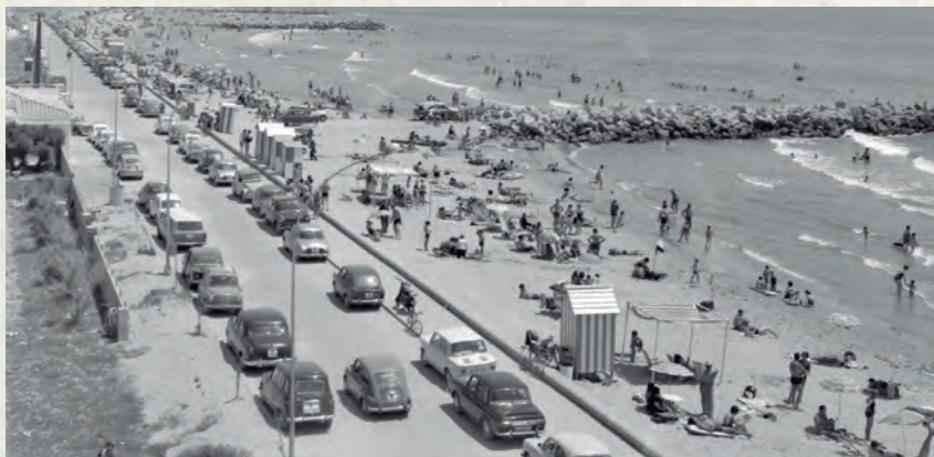
Una perspectiva del passeig Marítim i la platja des de l'Hotel Solimar.

A ressaltar també l'aprovació de l'ONU de la Declaració sobre la Igualtat de les Dones. I un fet crucial de l'any va ser el primer transplantament de cor realitzat pel Dr. Christiaan Barnard, a Sud-àfrica, el 3 de desembre. El pacient va morir 18 dies després a causa d'una pneumònia però la intervenció és considerada com una fita en la història de la medicina.