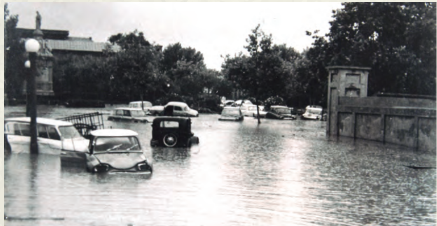
La plaça de l'Estació de Vilanova, aquell 12 d'agost de 1964 (Arxiu Comarcal del Garraf Fons Fotogràfic Municipal de Vilanova).

pagesos, esmaperduts, desapareixen, la indústria dorm encara, es perd aquella rancior característica, aquell tipisme llegendari, es malmeten records fins avui conservats. El pic i la paleta han substituït la rella i l'aixada". Tanmateix, en el seu escrit de doble sentit, deixava una esclatxa a l'esperança: "Tant se val, no tingueu quimera, Cubelles, amb tota aquesta transformació, precipitada, resistirà aquest shock aparent, aguantarà escomesa. Com una i altra volta sabrà fer front a qualsevol mal averany".