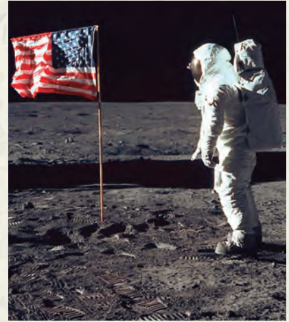
Neil Armstrong en el moment de trepitjar la Lluna.

Aquell estiu tingué lloc no solament un dels esdeveniments més destacats de la dècada sinó de la història de la Humanitat i la Tecnologia: l'arribada de l'home a la Lluna. La nau Apolo XI, tripulada per tres astronautes nord-americans, va ser enviada a l'espai des del Cap Kennedy (Florida) el 16 de juliol i el dia 20 arribava a la superfície lunar. L'endemà, el dia 21, Neil Armstrong es convertia en el primer home que trepitjava la Lluna. El seu company Edwin Aldrin el va acompanyar en la històrica passejada mentre el tercer tripulant, Michael Collins, restà a la nau espacial. Sobre la superfície lunar foren col·locades una bandera dels EUA i una placa