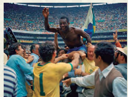
Pelé, després de conquerir la Copa del Món de Mèxic.

En l'àmbit internacional, al juny, Brasil s'adjudicava la Copa del Món de Mèxic practicant el millor futbol que mai s'havia vist fins aleshores, i al novembre Salvador Allende