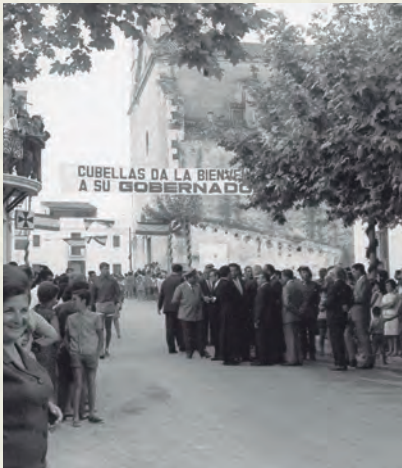
La visita del governador congregà una gran gernació. És una de les primeres imatges en què ja no es veu el pont del campanar (AAP).

manifestacions més grans viscudes a la Ciutat Comtal. Per altra banda, l'11 de juliol el Barça aconseguia un dels èxits més sonats de la seva història. Tot i que es tractava del títol de Copa, diverses circumstàncies van fer que aquell triomf fos èpic: la final era contra el R. Madrid, al propi estadi Bernabéu, amb un ambient crispat al màxim, amb llançament d'ampolles al terreny de joc, raó per la qual aquell partit és conegut com "la final de les ampolles". En l'àmbit internacional, 1968 va ser de gran efervescència. El 4 d'abril, a Memphis, el líder negre Martin Luther King, premi Nobel de la Pau, va ser assassinat quan es preparava per liderar una marxa. Poques setmanes després era Robert Kennedy qui patia un altre atemptat mortal quan acabava de ser escollit a les primàries com a candidat a la presidència dels Estats Units.