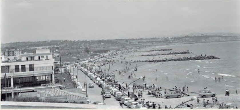
Una imatge de la platja en ple estiu.