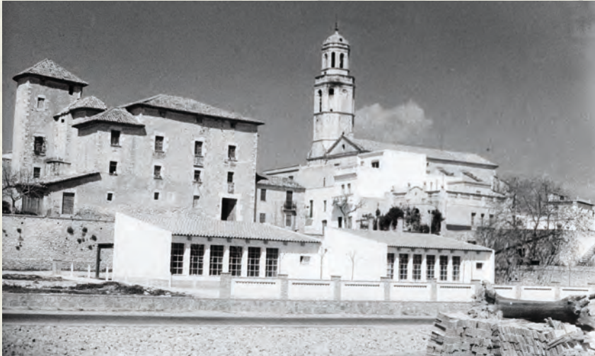
Una imatge de les noves escoles.