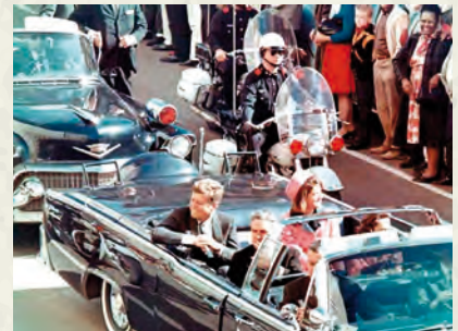
Kennedy, amb la seva esposa Jacqueline, instants abans que li desapareixin.

El 3 de juny moria Joan XXIII (Angelo Giuseppe Roncalli), conegut com el "Papa bo" i una de les figures més rellevants del segle XX. Ell va renovar l'Església amb el Concili Vaticà II, aportant un aire fresc i no fent distincions entre els creients i no creients. Va ser substituït per Pau VI. Però el fet mundial més destacat de 1963 va ser, indubtablement, l'assassinat de John F. Kennedy.