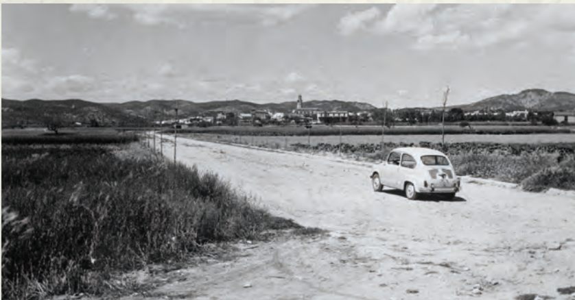
Una vista del que actualment és l'avinguda del Mediterrani, l'any 1961 (AAP).