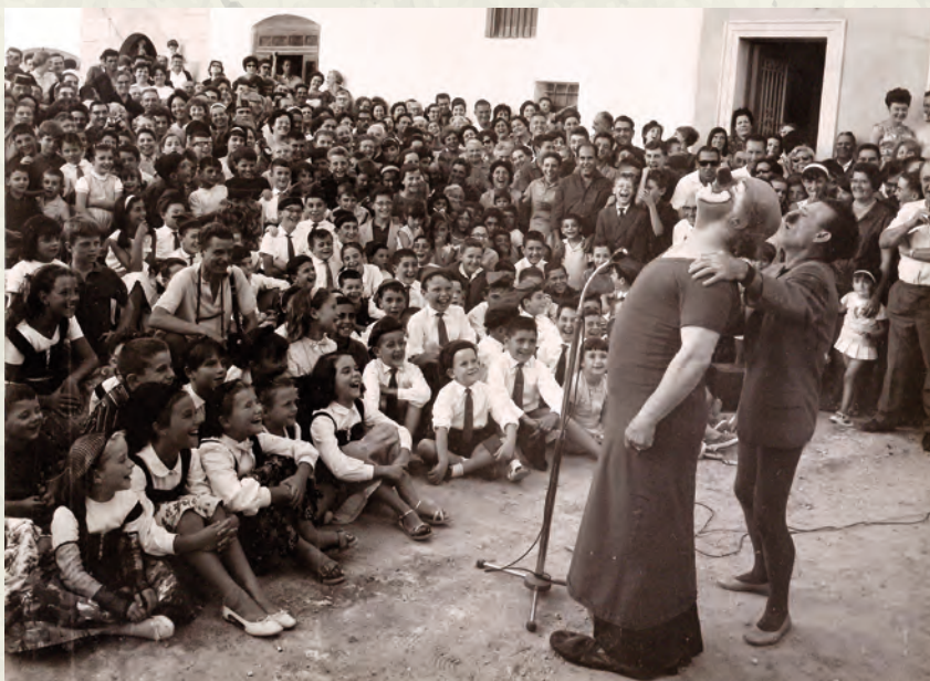
L'actuació de Charlie Rivel a la plaça de la Vila (AAP).

Per últim, no podem passar per alt que al 1963 arriben els primers èxits del grup musical més impactant de la història i amb el qual ha quedat identificada aquella dècada: The Beatles.