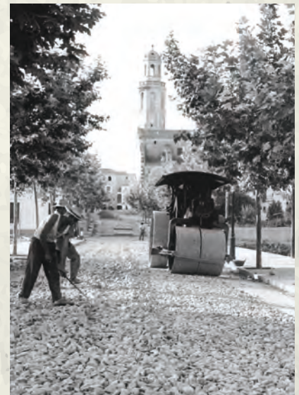
Asfaltat de la Rambla, l'any 1961.