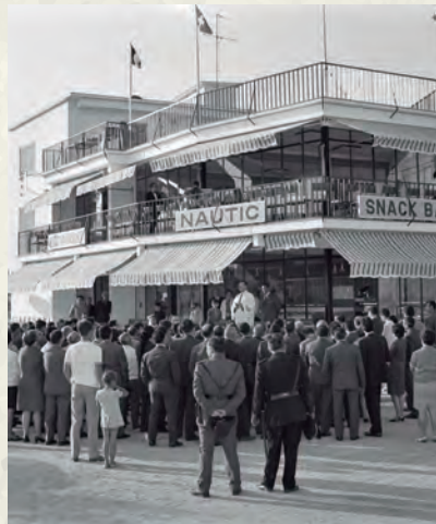
Inauguració del Restaurant Nàutic.