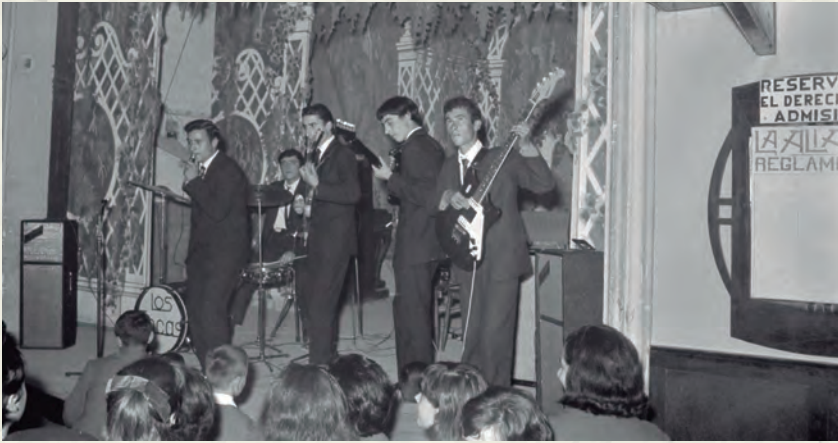
Actuació de Los Incas a L'Aliança (AAP).

Amb un cens de població de 1.141 habitants, el 1965 va ser important perquè per primera vegada es va aprovar el Pla General d'Ordenació Urbana. Va ser redactat per l'arquitecte municipal, Joan B. Estevan Llagaria, i aprovat definitivament el 25 d'octubre d'aquell any. La seva principal utilitat va ser la de legalitzar situacions existents i la de catalogar el sòl en diverses àrees: Nucli urbà; Eixample; Ciutat jardí; Camp urbanitzable; Reserva de comunicacions i sòl rústec (no urbanitzable). Una de les seves deficiències, dins l'apartat de camp urbanitzable, era que deixava la porta oberta a la creació de plans parcials de manera aleatòria i en funció dels interessos de la iniciativa privada. Malgrat això, les ordenances promogudes per l'arquitecte van ser, si més no, beneficioses estèticament, en el sentit que només es permetia construir planta baixa i dos pisos, impedit així que a Cubelles es fessin edificacions forassenyades com va passar en la majoria de pobles del litoral.